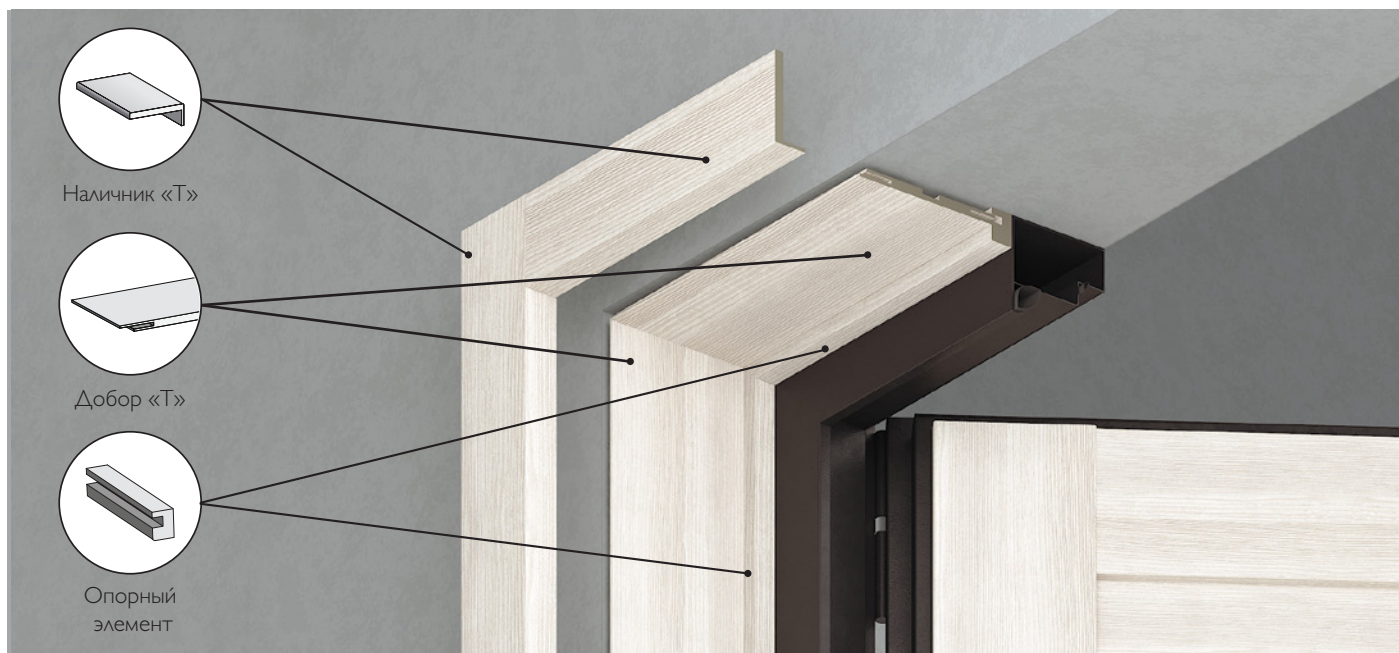
СХЕМА СОЕДИНЕНИЯ ДОБОРОВ С ИСПОЛЬЗОВАНИЕМ ШПОНКИ